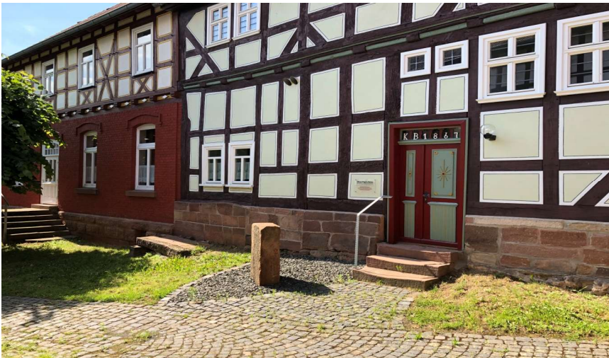
Kulturelles Dorfarchiv und Ortsvorsteherbüro, Kirchweg 4

Der Heimat und Kulturverein Bauerbach e.V. teilt ergänzend mit, dass die abgedruckten Öffnungszeiten bis auf weiteres gelten